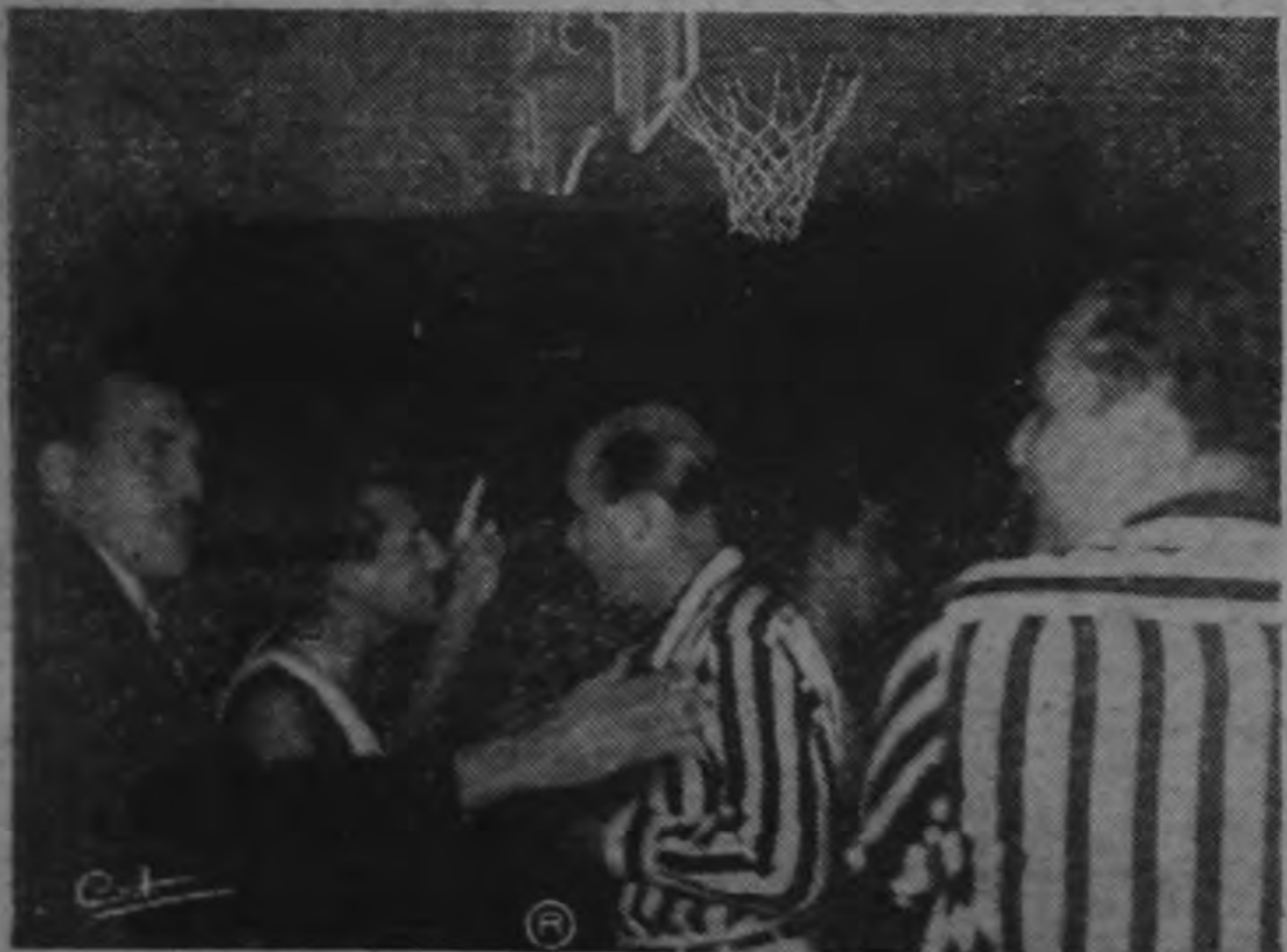
Esta escena corresponde al último partido de la serie de basketbol con el Athletic de Guayaquil, que se retiró invicto. En la última noche, la compostura deportiva estuvo a punto de perderse. Hubo discusiones y reclamos, pero finalmente se impuso la corrección.