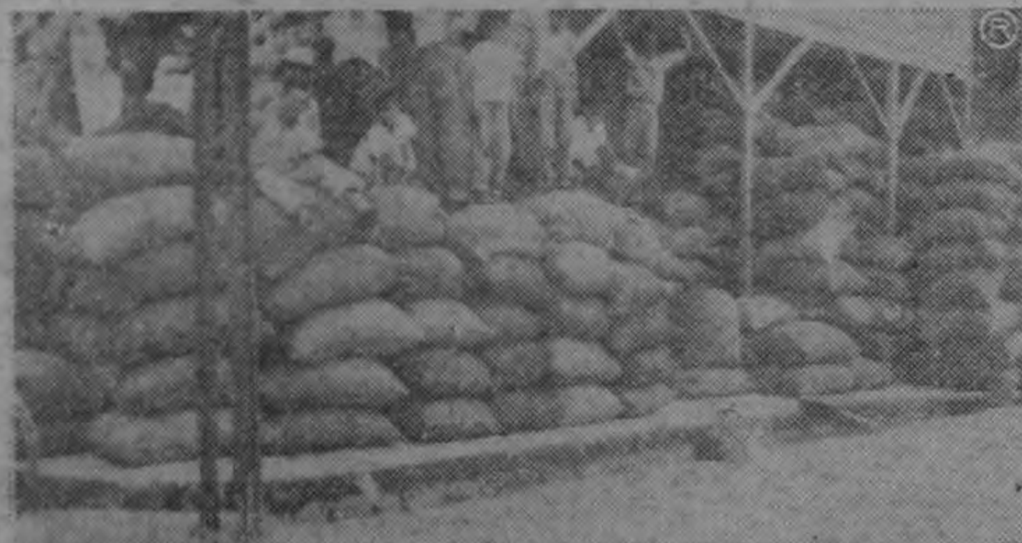
Esta fotografía nos ha sido enviada desde Quepos a fin de que, al ser publicada, llegue a conocimiento del Consejo Nacional de la Producción que en esa localidad hay una gran cantidad de arroz expuesta a la intemperie a la espera del funcionario encargado de recibirlo. La nota que acompaña la foto contiene expresiones muy elogiosas para el Consejo por la eficaz ayuda que presta a los agricultores. Y para que sea más valiosa debe también ser oportuna.